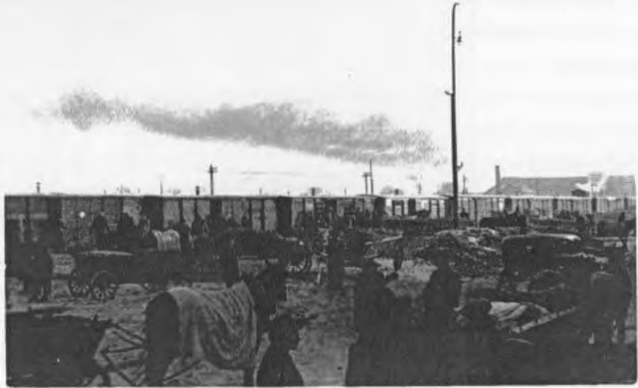
- Einwaggonierung der Deutschen aus der Sprachinsel Mariahilf -