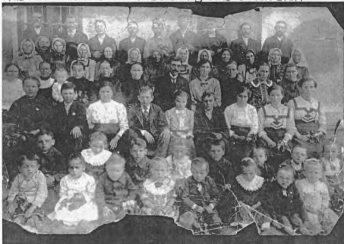
Aufnahme aus dem Jahre 1918 Rückkehr nach dem 1. Weltkrieg aus Österreich