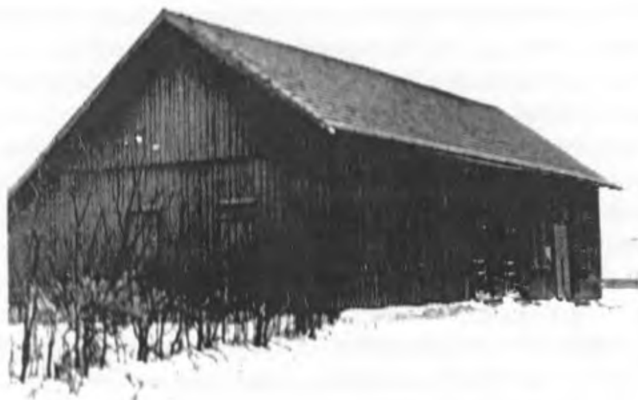
Winter 1939/40 - kurz vor der Umsiedlung: > Deutsches Haus < Tötenstille - Leben und Treiben sind erloschen -