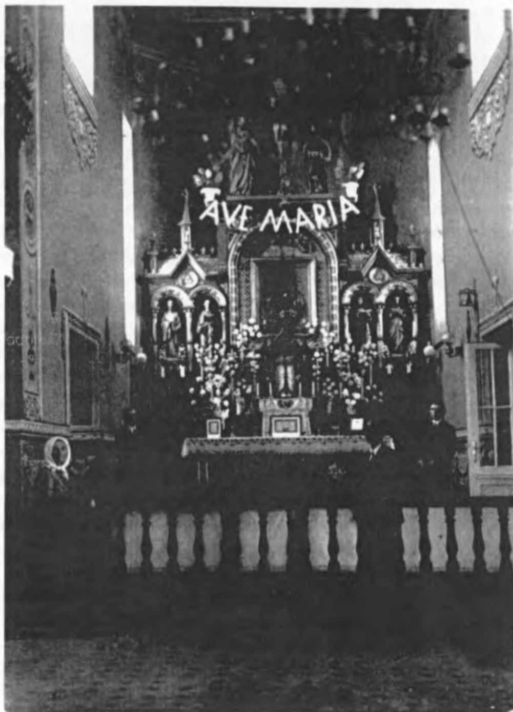
Altar der Pfarrkirche