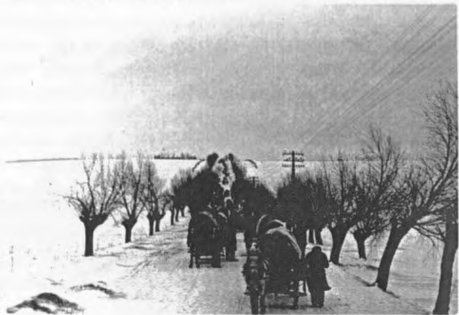
- Treck der Mariahilfer in kahler, verschneiter Winterlandschaft -