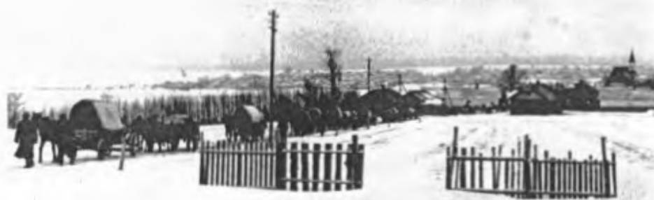
> Treck der Mariahilfer Sprachinsel <