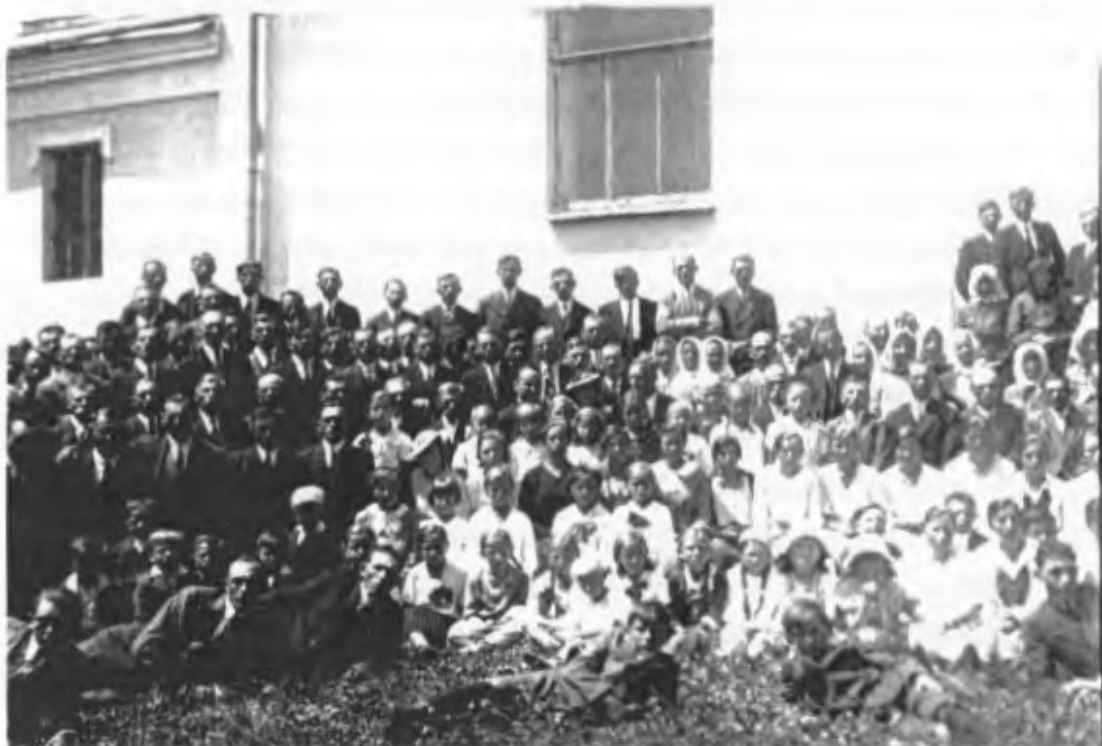
- Kirchengemeinde - Mariahilf