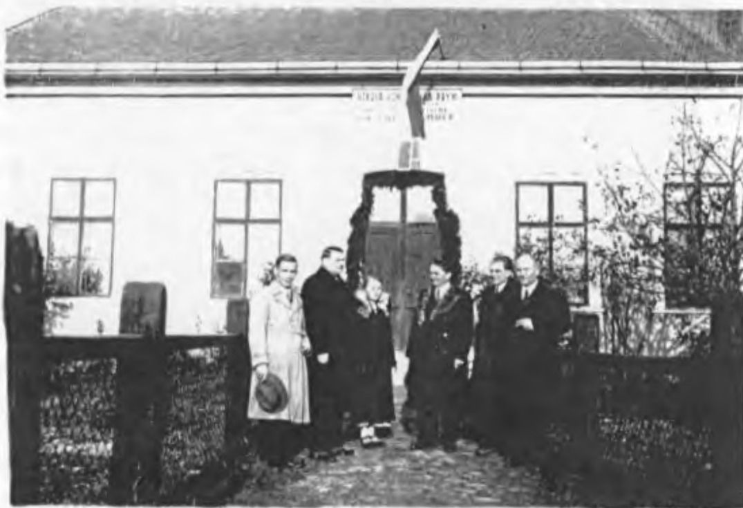
vor der Roseggerschule