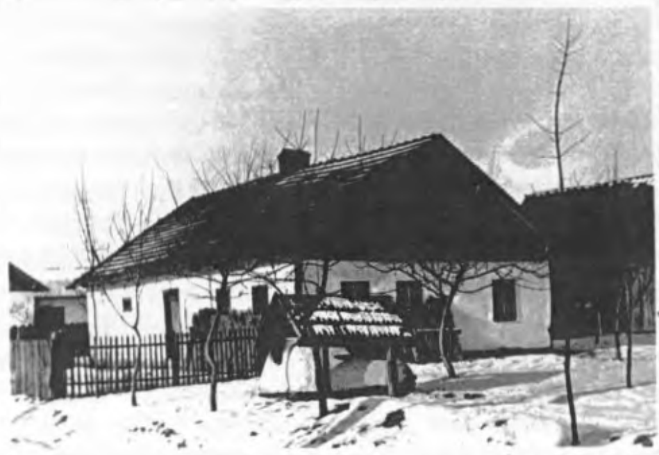
Winter 1939/40 - einer der letzten Backöfen im Freien - > Haus von Ferdinand Blechinger <