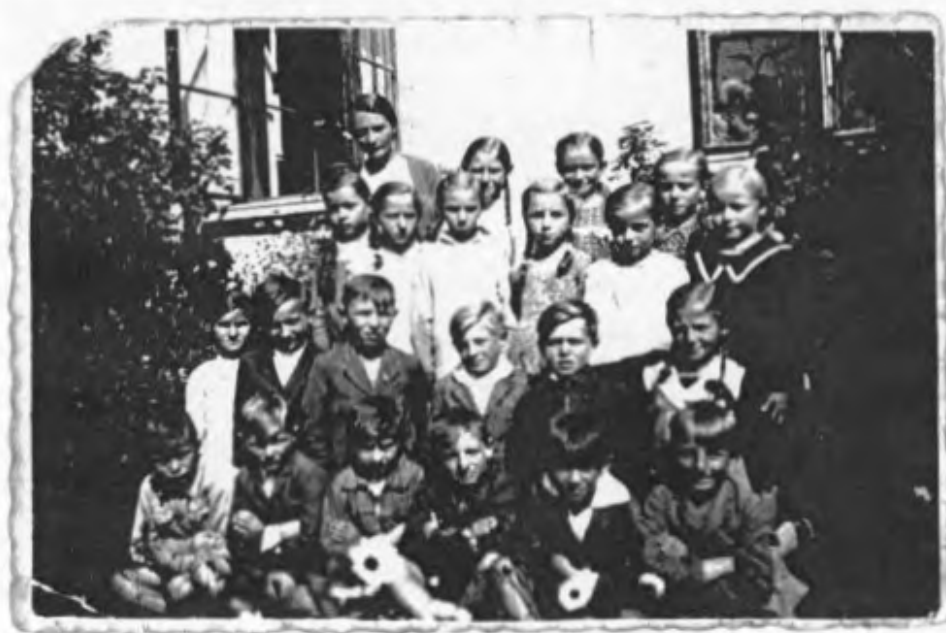
im September 1936 vor der deutschen Schule