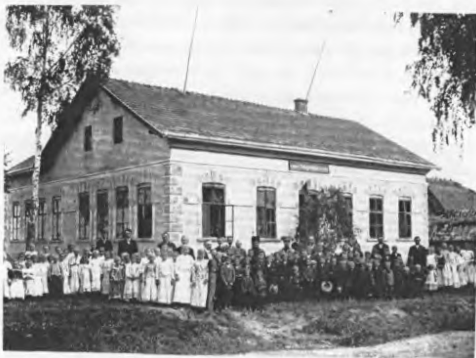
Einweihung der Roseggerschule 1910