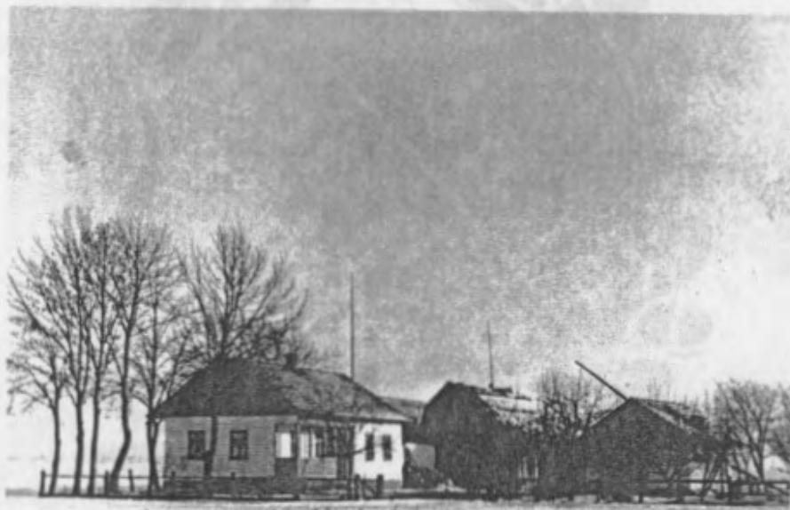
Fieberg: Hof des Altrichters JOSEF KOLMER Geburtshaus des Verfassers